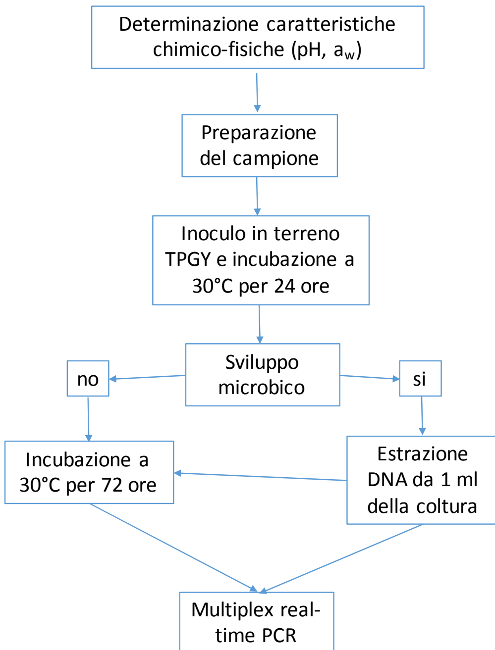
DIAGRAMMA DI FLUSSO DEL METODO PER LA DETERMINAZIONE DEI CLOSTRIDI PRODUTTORI DI TOSSINE BOTULINICHE MEDIANTE MULTIPLEX REAL-TIME PCR